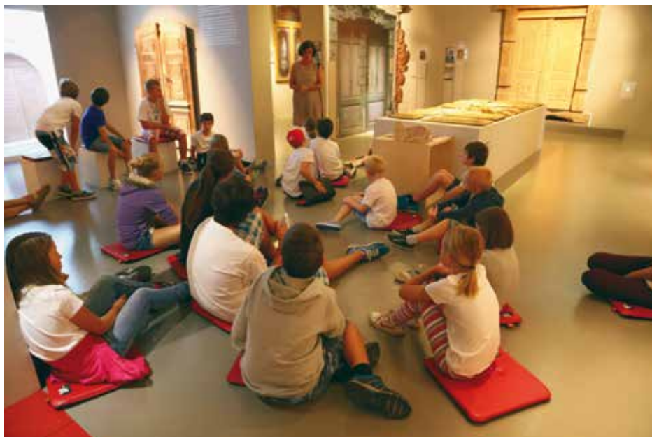
Vodstvo za otroke po razstavi Vrata: prostorski in simbolni prehodi življenja