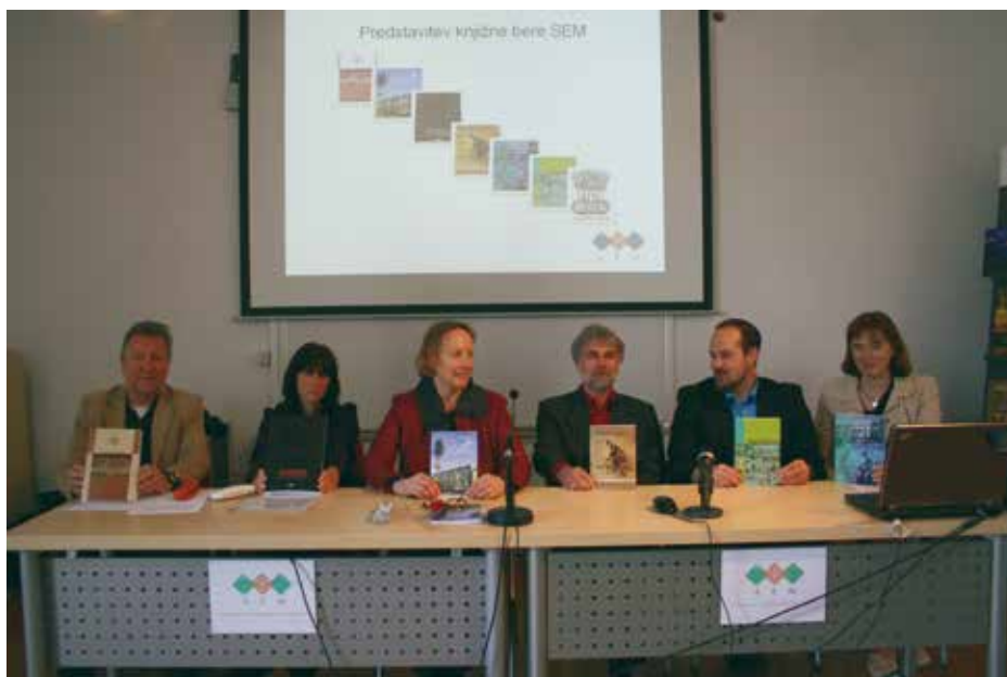
Predstavitev knjižne bere SEM v 2013