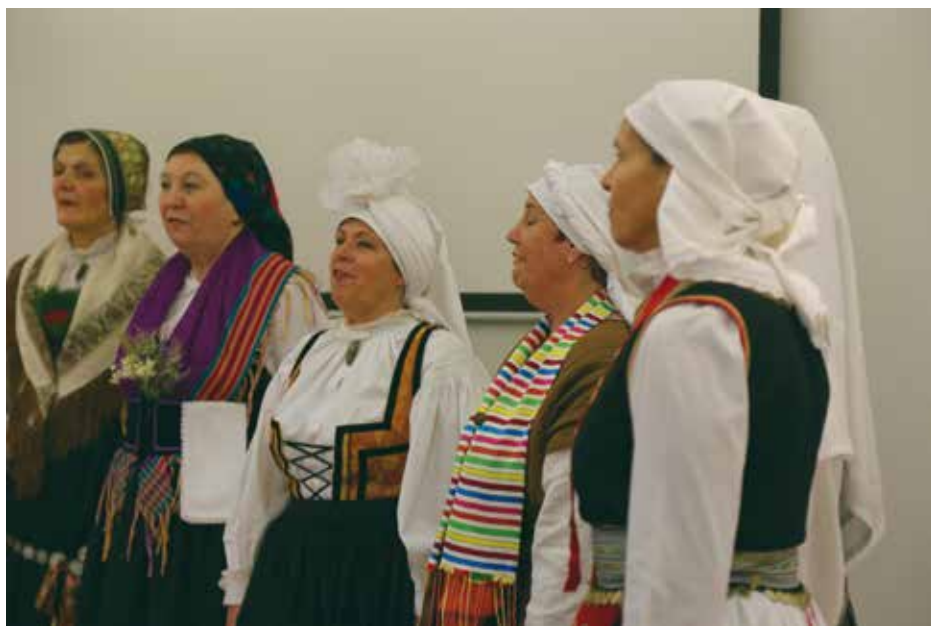
Glasbeni nastop skupine Cintare, Mi novo leto pojemo