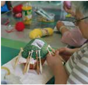
Klekljanje na Sobotnem prepletanju