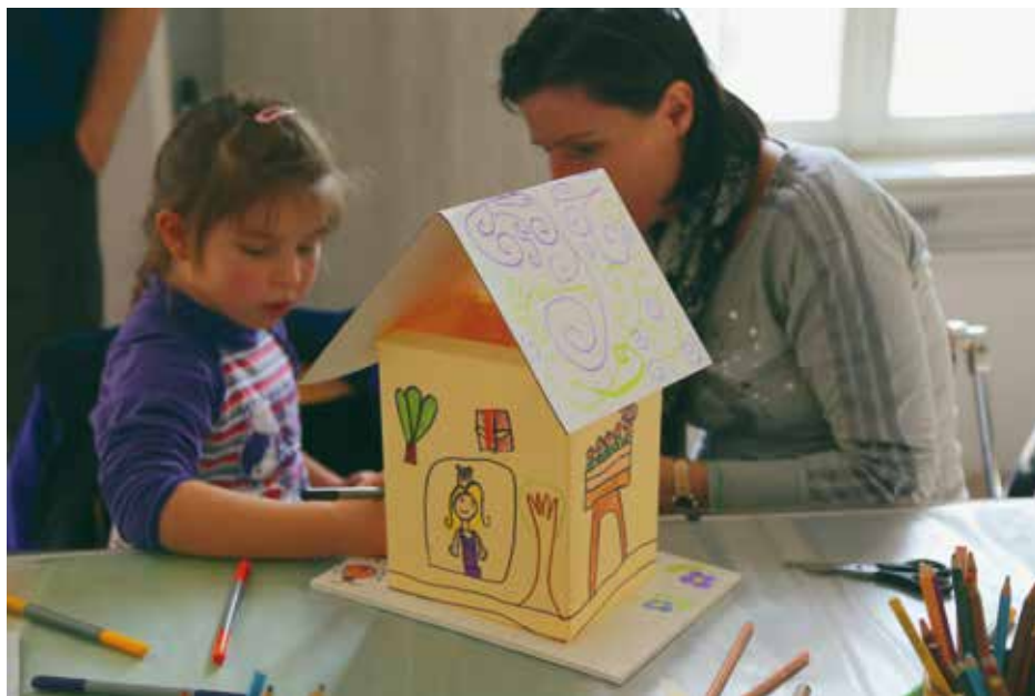
Ustvarjalna delavnica Gregorčki in pomlad