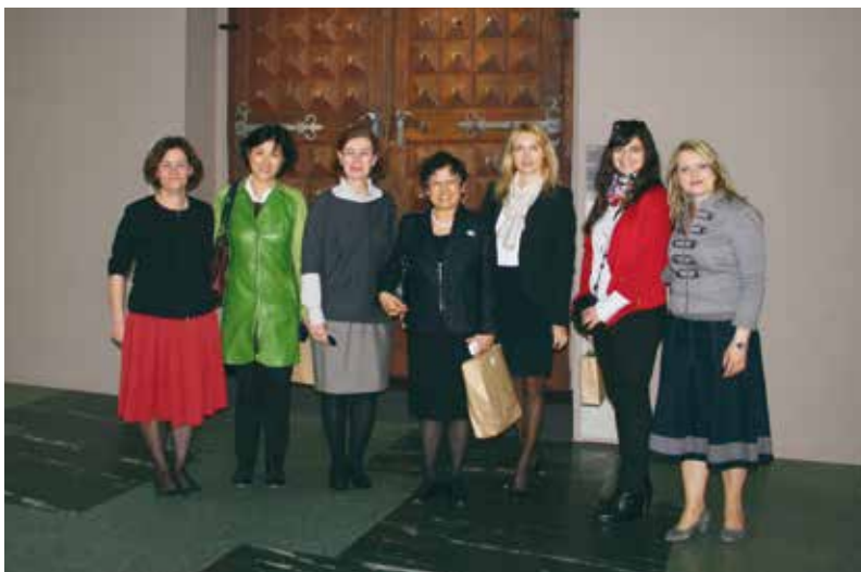
SEM si je ogledala soproga generalnega direktorja UNIDA.