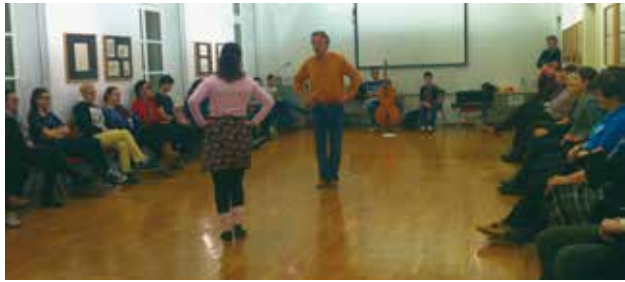
Delavnica slovenskih ljudskih plesov. Vstop v slovensko plesno hišo