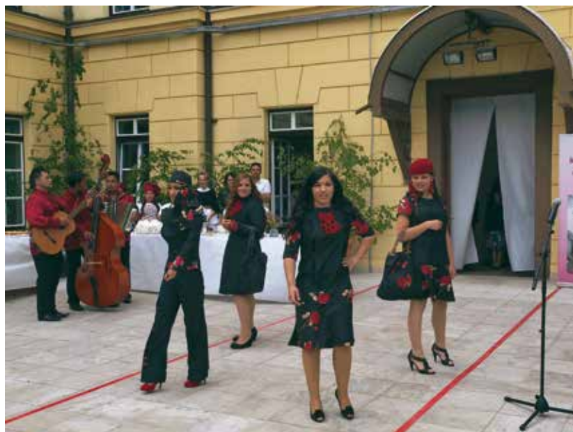
Modna revija in glasbeni nastop na dogodku Kamenci z okusom