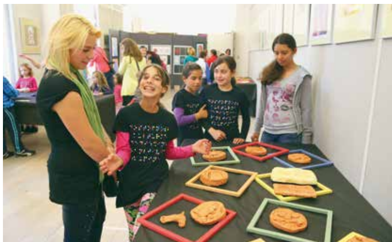
Razstava izdelkov otrok z naslovom Dotik mojih vrat