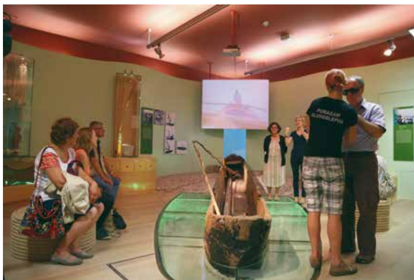
Društvo Dlan, vodstvo po razstavi Med naravo in kulturo