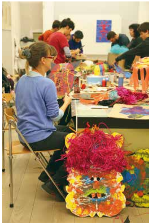
Delavnica za odrasle, izdelava mask, skupina Oficina Arara