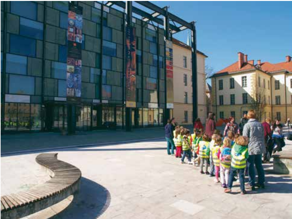
Slovenski etnografski muzej

V letu 2014 je Slovenski etnografski muzej obiskalo 25.064 obiskovalcev. Poleg razstav je muzej pripravil tudi številne dogodke in prireditve, ki se jih je udeležilo 7608 obiskovalcev. Muzejske razstave je obiskalo 354 skupin različnih starosti (pretežno šolarjev).