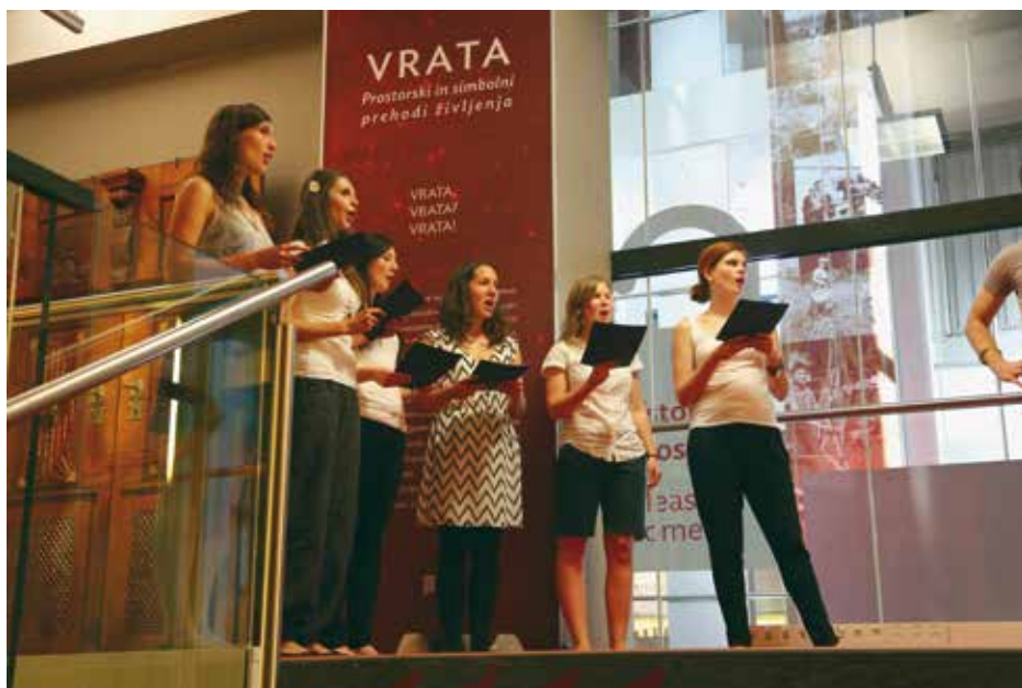
Glasbeno vodstvo Mi smo nocoj malo spale po razstavi Vrata , pevke SEM